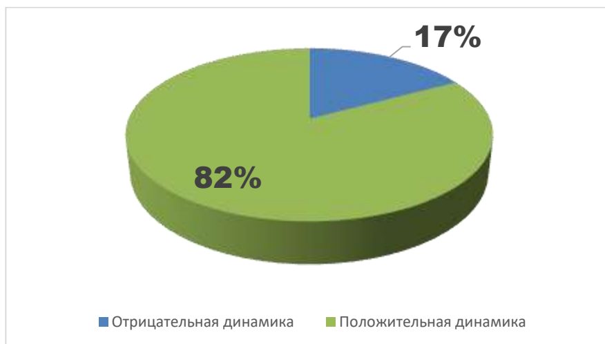
Диаграмма 5. Результаты коррекционной работы